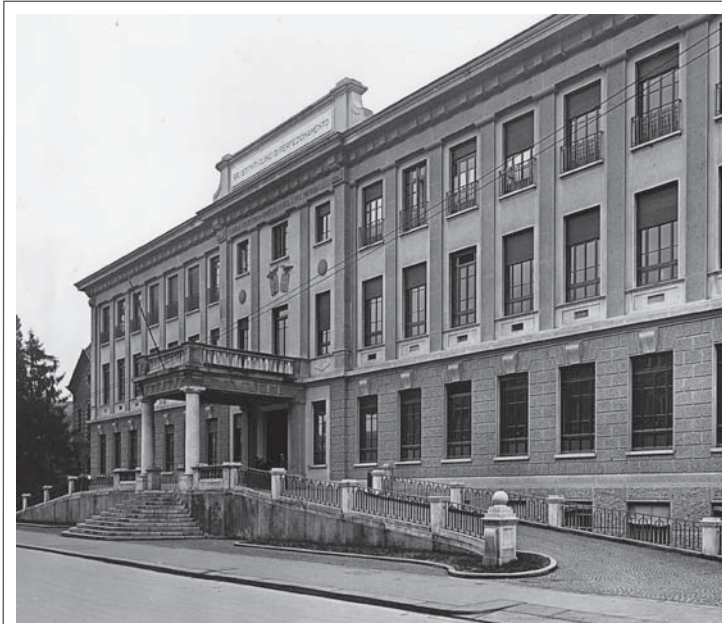
La facciata della Clinica Mangiagalli dopo l'ampliamento del 1931