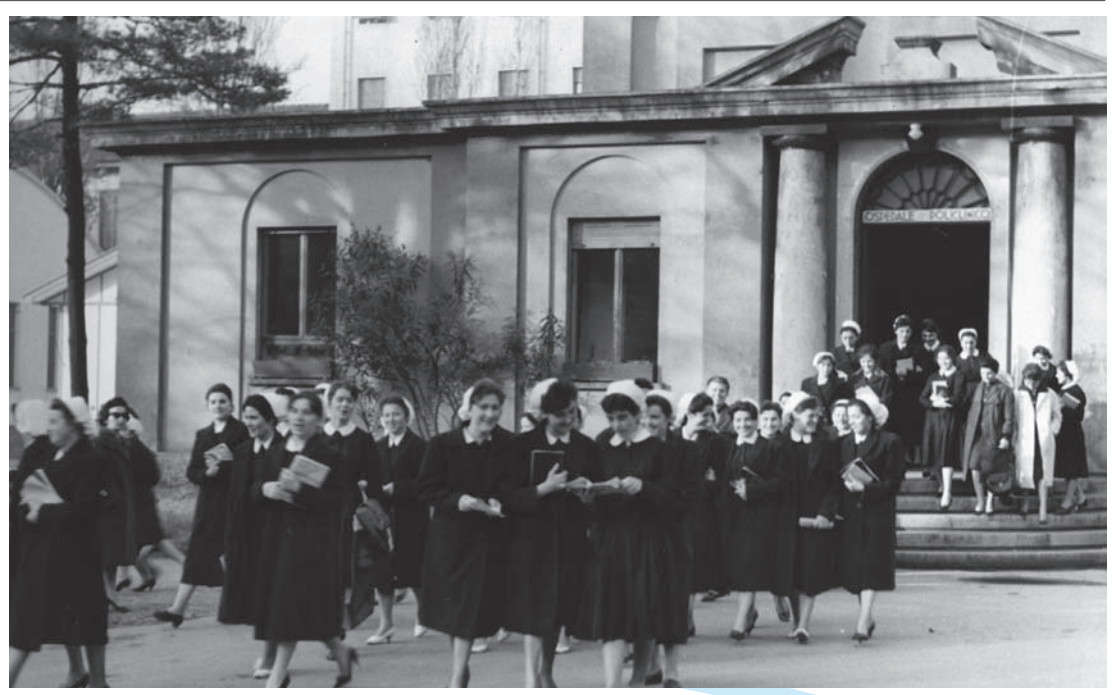
■ 1960 - Allieve infermiere escono dall'Aula Borghi

I 6 mesi di follow up post intervento hanno, inoltre, evidenziato che la tonsillectomia è efficace nel ridurre le recidive di faringotonsillite e di malattie respiratorie acute in presenza di tali infezioni. Questi esiti aprono la strada per studi ad hoc che valutino se una terapia antimicrobica mirata possa permettere di ridurre l'indicazione alla tonsillectomia nei bambini con infezione tonsillare da batteri atipici.