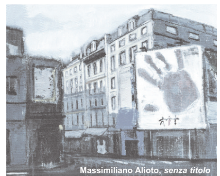
Massimiliano Alioto, senza titolo