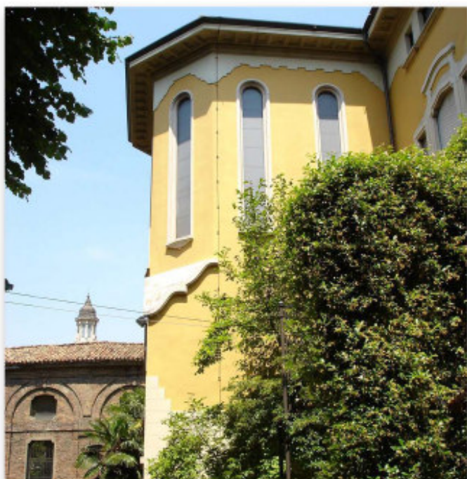
Uno scorcio del 'Polo didattico Valetudo'. Sullo sfondo, la Rotonda della Besana.