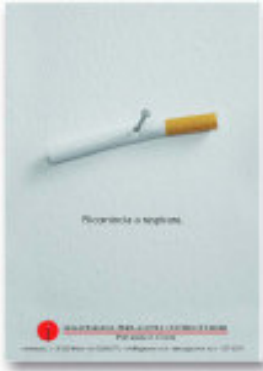
Campagna contro il fumo della Lega Italiana per la Lotta contro i Tumori di Milano

Per l'onorevole Domenico Di Virgilio, Sottosegretario alla Salute, il fumo 'è un problema ricco di implicazioni etiche, oltre che sanitarie, sociali, giuridiche, scientifiche ed economiche'. Allo Stato compete la responsabilità di combattere la battaglia nell'interesse dei fumatori e, soprattutto, e dei non fumatori. Il Ministero della Salute ha infatti sostenuto l'approvazione della nuova legge per la tutela della salute dei non fumatori (Legge 3/2003, art. 51, entrata in vigore il 10 gennaio 2005) che si sta rivelando di im-