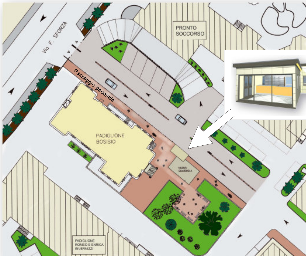
Il progetto del nuovo ingresso e della piazzetta e, in piccolo, la nuova portineria